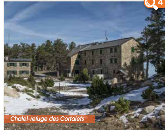
Chalet-refuge des Cortalets