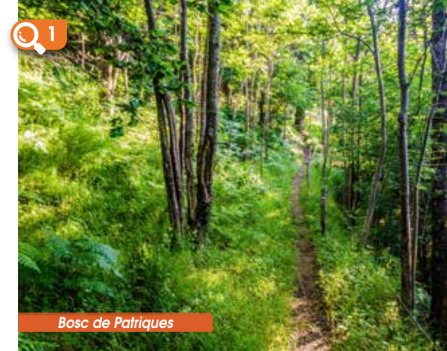
Bosc de Patriques

4 Du ras, prenez la piste sur votre gauche, en direction du refuge. Après 300 mètres de marche, prenez encore sur votre gauche un sentier, qui monte en lacets jusqu'au refuge des Cortalets. Le sommet du Pic du Canigó n'est plus qu'à deux heures d'ascension.