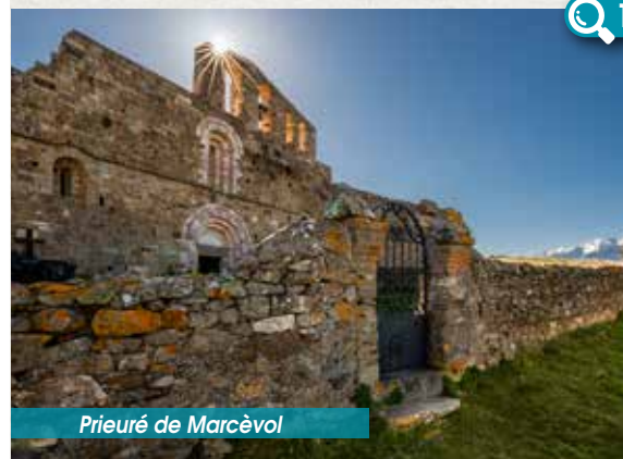
Prieuré de Marcèvol