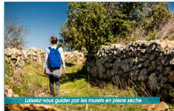
Laissez-vous guider par les murets en pierre sèche

3 De l'intersection, laissez sur votre droite le chemin de la boucle qui mène à Arboussols et prenez le chemin de gauche. Continuez en direction du sud-est sur 850 mètres, puis vers l'est jusqu'à l'intersection avec le chemin emprunté à l'aller. Reprenez le sentier suivi à l'aller pour revenir à votre point de départ.